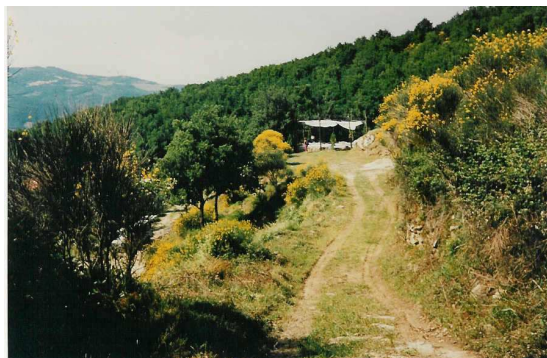
Weg zum Tanzplatz